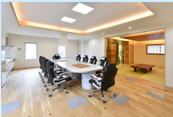
太陽の光が差し込む、気持ちのよい、広々とした空間でお楽しみ頂けます。